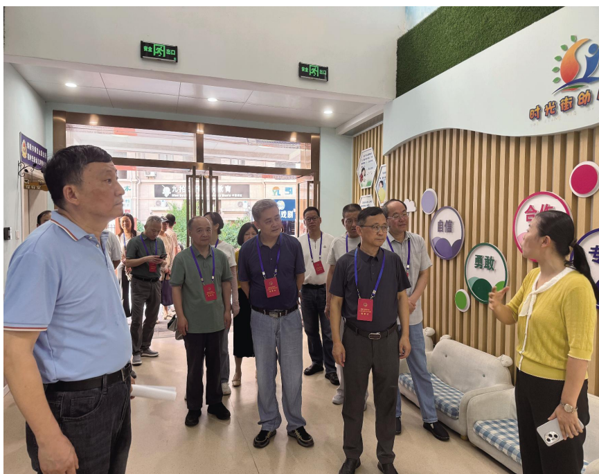
铜官区人大常委会集体视察民生实事项目建设情况。

作为发展全过程人民民主的重要抓手，积极谋划对镇办社区人大代表联络站进行全面整合升级。投入专项资金高标准改造7个全过程人民民主基层实践站点（代表联络站），建成并投入使用区人大践行全过程人民民主中心实践站（人大代表联络中心站），形成了“中心站引领、基层站联动、站点成网”的阵