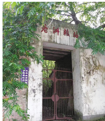
图为新四军七师老洲地下交通站遗址

寒暑往来,变换的是季节,不变的是忠贞不渝的品格。日出日落,逝去的是时间,逝不去的是坚如磐石的信念! 83 年来,新四军七师老洲地下交通站旧址就那么默默矗立着,矗立在这片生机盎然的热土上,矗立在洒满青春热血与无悔追求的历史长河中,成为一个时代不灭的记忆,成为一个民族永恒的精神坐标。新四军七师老洲地下交通站的革命先辈,虽然永远的离开了我们,但他们为了革命,为了新中国,出生入死,前赴后继,甘洒热血写春秋的革命精神,永不消逝,我们会一代代传承下去!