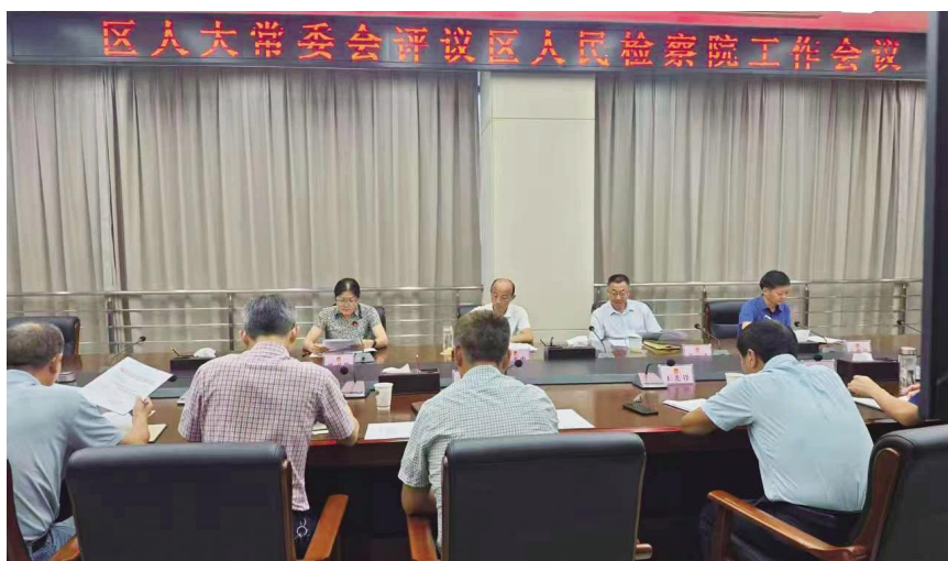
2025年7月，义安区人大常委会对区检察院开展工作评议。

铜陵市义安区人大始终把工作评议作为人大工作的重中之重，紧抓不放，使之像鞭子、像号角、像广播，鼓舞士气，催人奋进，传播人大声音。