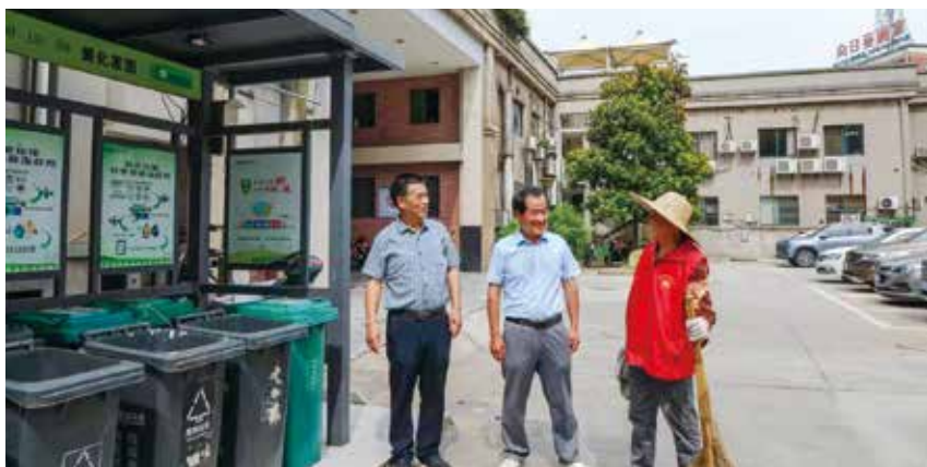
▲义安区人大代表走访了解垃圾分类情况

一是人大开展的活动，必须积极争取党委重视和“一府一委两院”配合支持。区人大常委会对区政府工作部门开展工作评议，一直得到区委的高度重视和区政府积极配合支持。每年初，区人大常委会将开展工作评议列入年度工作要点，报区委研究批准。区委高度重视和区政府大力支持，促使工作评议得以扎实有