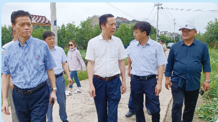
▲ 7月20日，市人大常委会副主任陈元中调研村级集体经济发展情况。