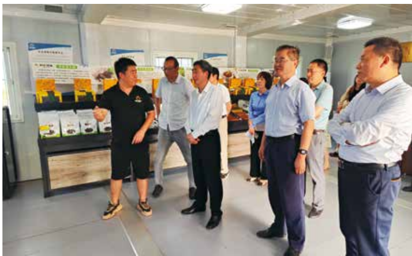
▲市人大常委会副主任汪宜武调研专项债项目实施情况

二、深化改革,着力提高财政管理水平。 积极有效推进零基预算改革,打破支出固化格局,构建该保必保、应省尽省、讲求绩效的资金安排机制。强化部门单位收入统筹,推动跨部门资金整合,提升部门工作的系统性、