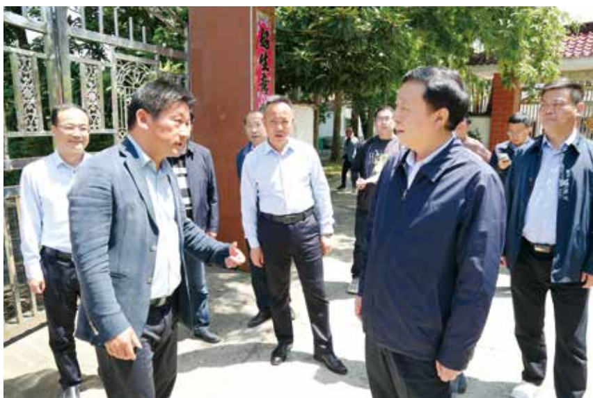
▲ 市人大常委会主任张梦生走访联系市人大代表

深入贯彻习近平法治思想，坚持全面依法治国，是全党全社会的共同责任。地方人大作为立法机关和法律实施监督机关，处于社会主义民主法治建设第一线，更是责无旁贷。全市人大要以习近平法治思想为指导，坚持党的领导、人民当家作主、依法治国有机统一，紧扣党的二十大