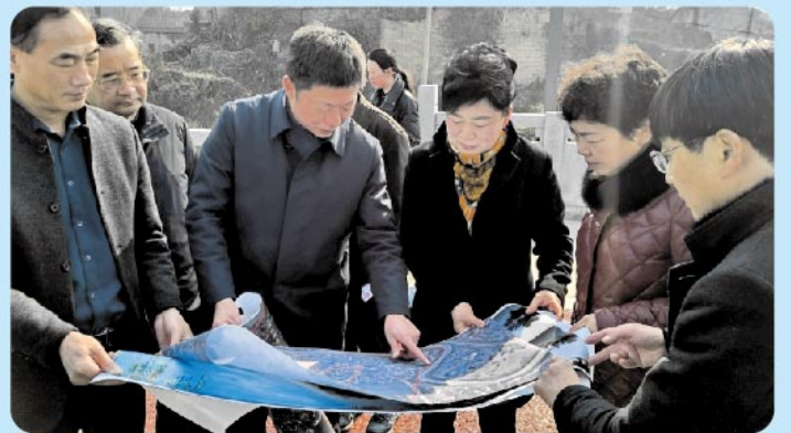
▲ 2月16日，市人大常委会副主任郑晓艳率队赴枞阳县开展议案审查调研活动。