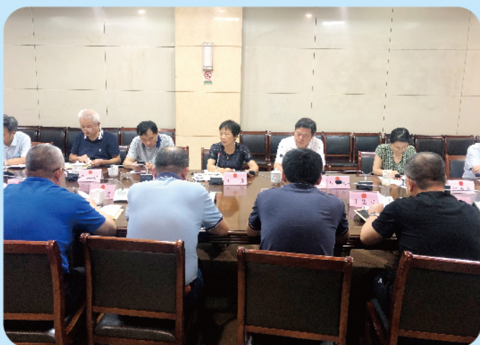
▲ 9月9日，市人大常委会副主任叶萍参加《铜陵市工业遗产保护与利用条例》贯彻落实情况座谈会。