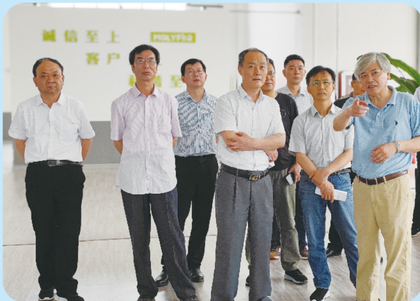
▲ 6月1日，市人大常委会党组副书记、副任何刚明带队赴义安区开展《中华人民共和国固体废物污染环境防治法》执法检查。