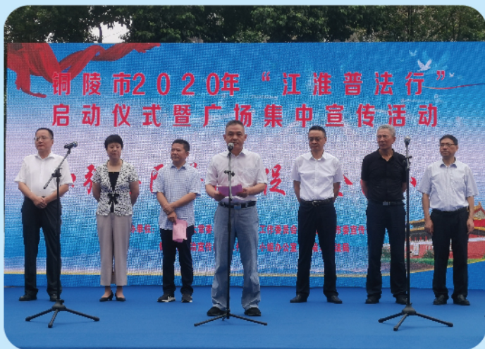
▲ 8月21日上午，铜陵市2020年“江淮普法行”活动启动仪式在万达广场举行。市人大常委会副主任陈昌生出席仪式并宣布活动启动。