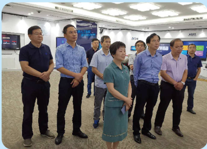
▲ 9月2日至9月3日，市人大常委会副主任叶萍率在铜部分省人大代表围绕战略性新兴产业发展情况开展调研。