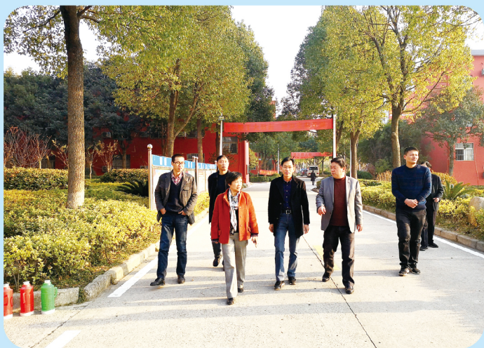
▲ 12月11日，市人大常委会副主任叶萍率队调研民办教育工作