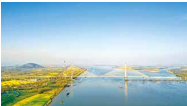
池枞大桥