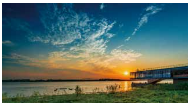
滨江书屋夕照