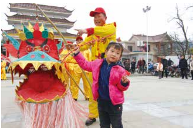
舞龙 (余庆平 / 摄)