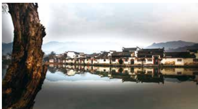
又见宏村