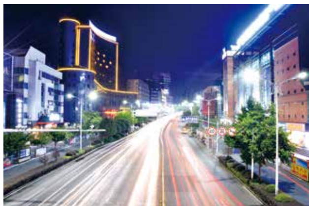
时光隧道