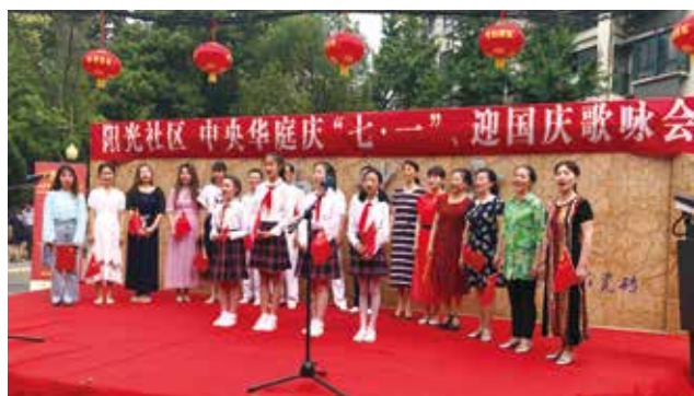
阳光社区