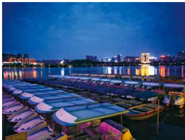
井湖夜色