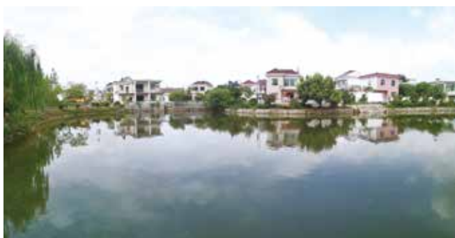
温馨福地 孝亲金塔