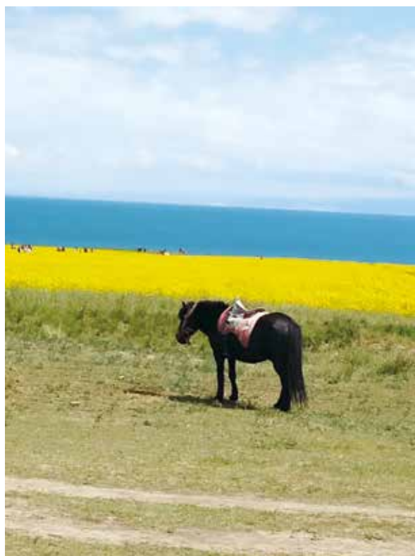
青海湖边