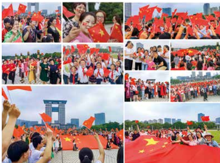
我和我的祖国