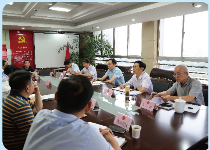
▲8月29日，市人大常委会副主任陈元中率队调研小区停车难工作