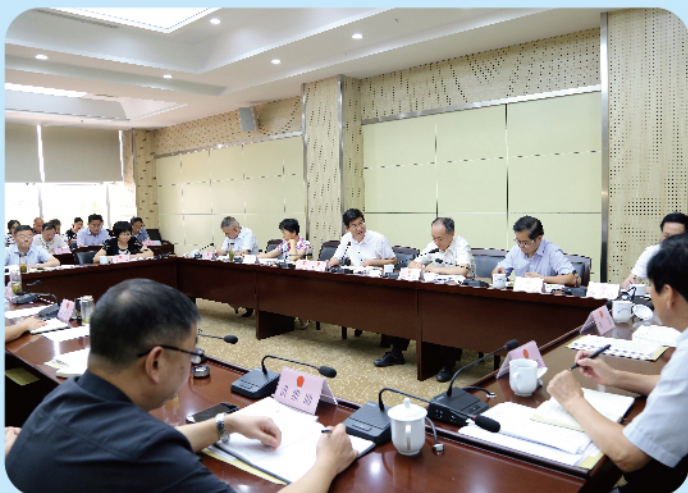
▲7月31日，市人大常委会召开会议听取“一府两院”上半年工作情况汇报,市委书记、市人大常委会主任李猛主持会议并讲话