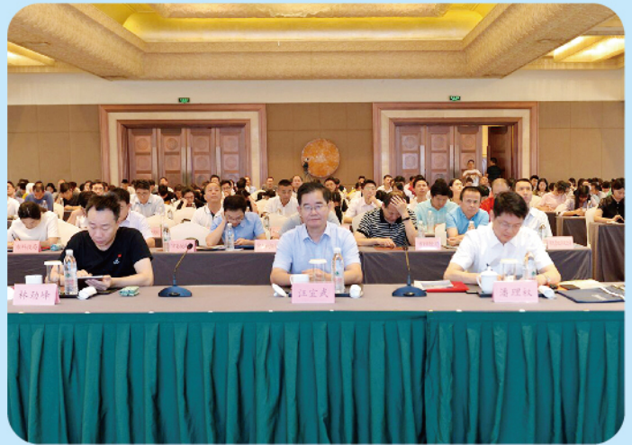
▲6月21日，市人大常委会副主任汪宜武参加创业高峰论坛和资本对接会启动仪式