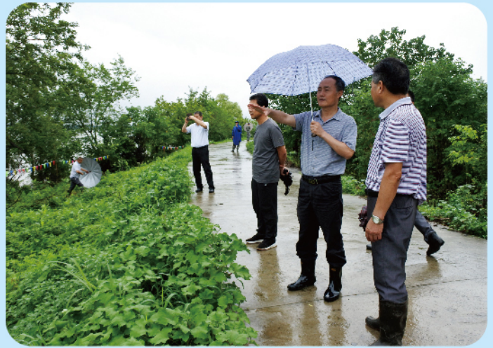
▲6月19日，市人大常委会党组副书记、副主任何刚明前往脱贫攻坚帮扶联系村，开展脱贫攻坚督查暨“两不愁三保障”和饮水安全突出问题大排查活动