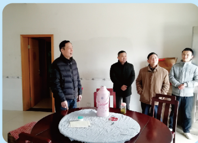
▲市人大常委会副主任陈元中率队调研我市农民收入增长情况