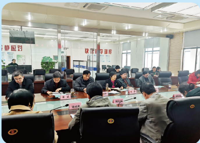
▲市人大常委会副主任叶萍参加一季度全市人大教科文卫工作座谈会