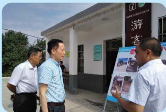
▲陈元中副主任率队调研脱贫攻坚工作