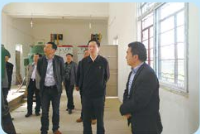
▲市人大常委会副主任陈元中率队视察泵站建设