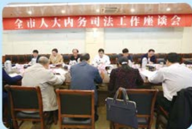
▲市人大常委会副主任陈昌生参加全市人大内务司法工作座谈会