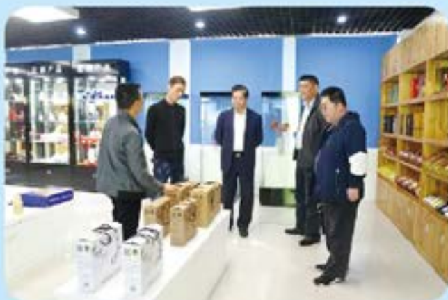
▲市人大常委会副主任汪宜武率队调研我市电子商务企业发展情况