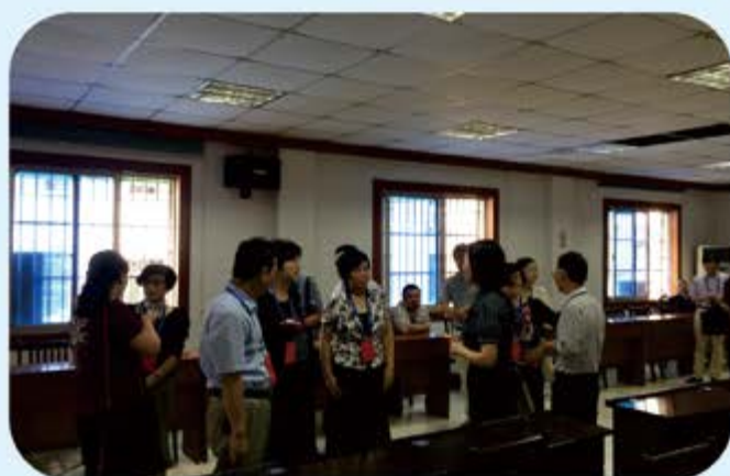
●铜官区人大开展对区人社局工作评议调研