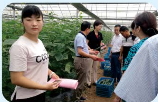
●枞阳县人大集体视察桐源农业科技有限公司