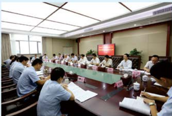
●市人大常委会调研全市法院基本解决执行难工作