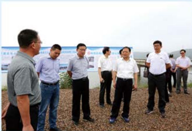
●市人大常委会集体视察民生工程实施情况