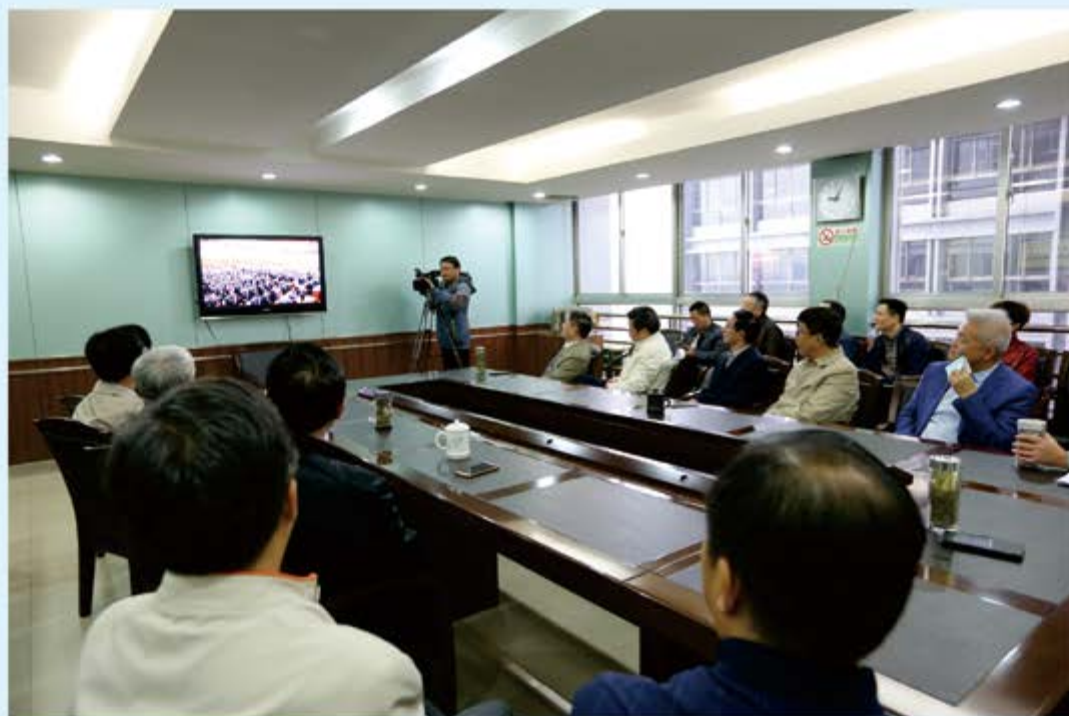
●市人大常委会及机关集中收看党的十九大开幕式