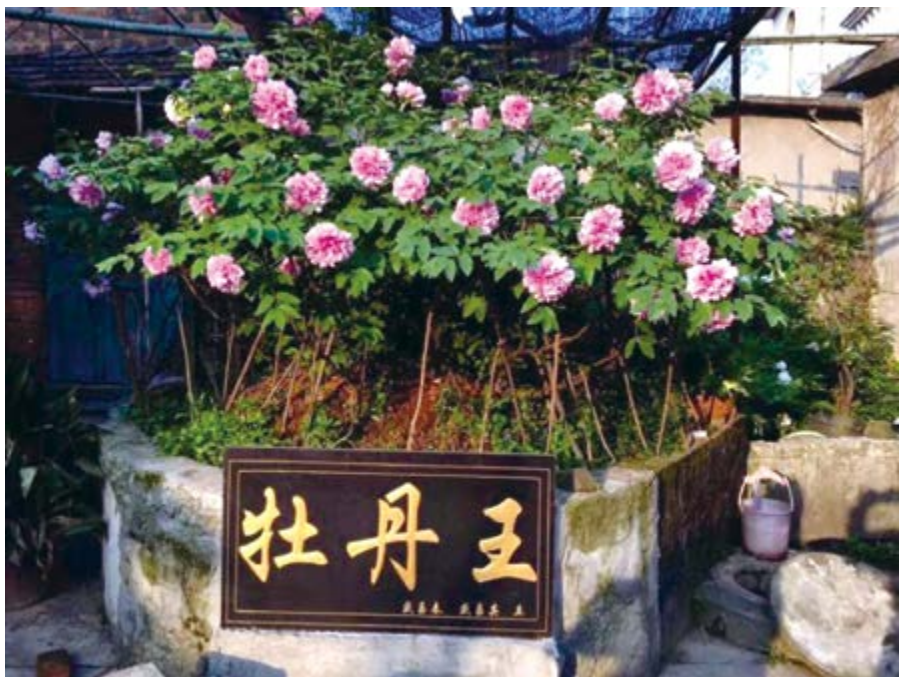
图为：盛氏牡丹如今照片