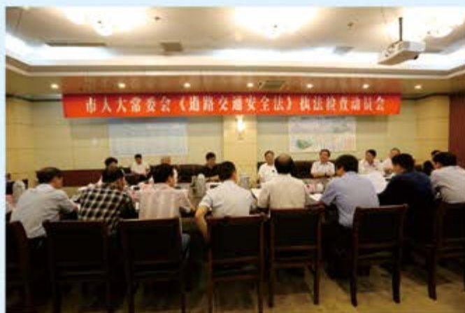
●市人大常委会召开《道路交通安全法》执法检查动员会