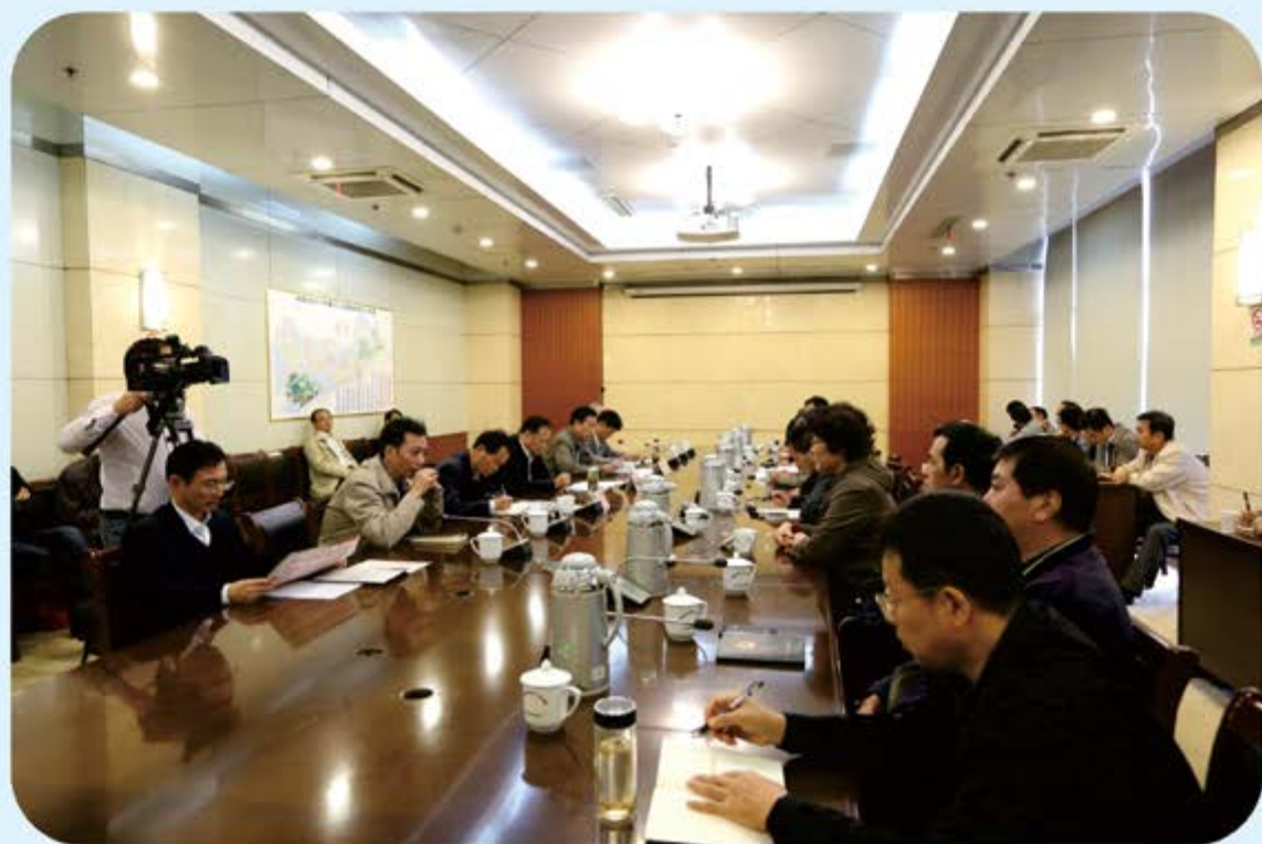
●市人大常委会及机关召开学习党的十九大精神暨“讲重作”专题警示教育总结会