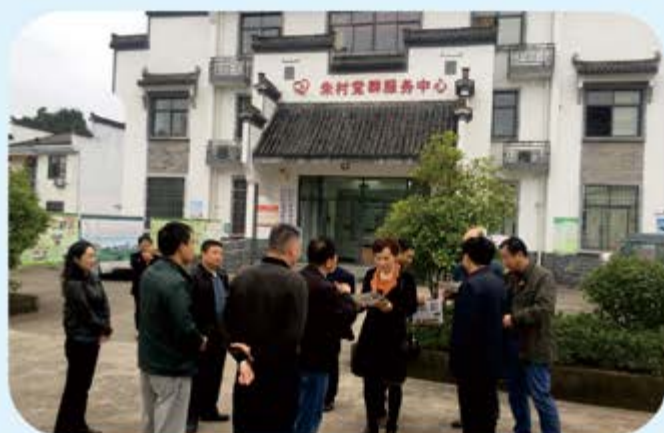
●郊区人大赴黄山市考察学习美丽乡村建设