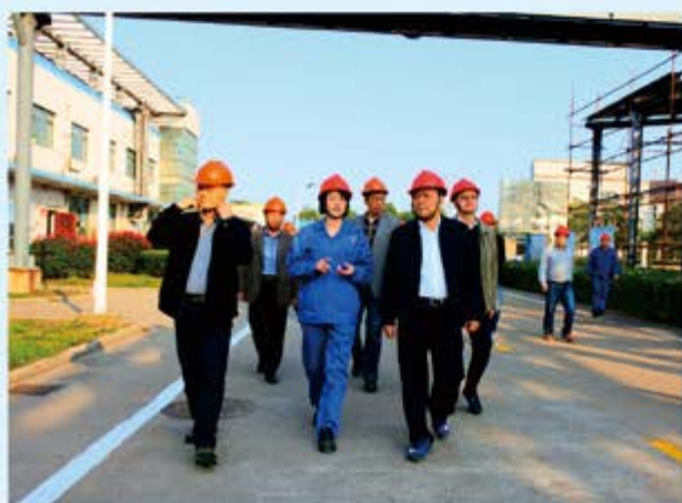
●市人大常委会督查环保问题整改落实情况