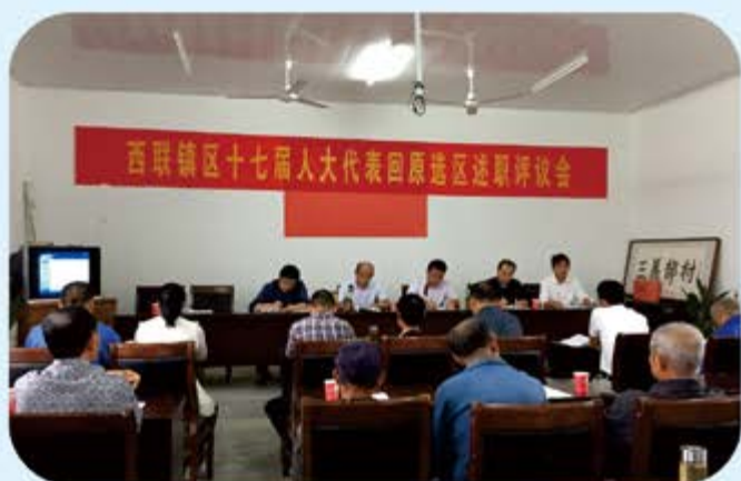
●义安区新一届人大代表回原选区接受选民“检测”