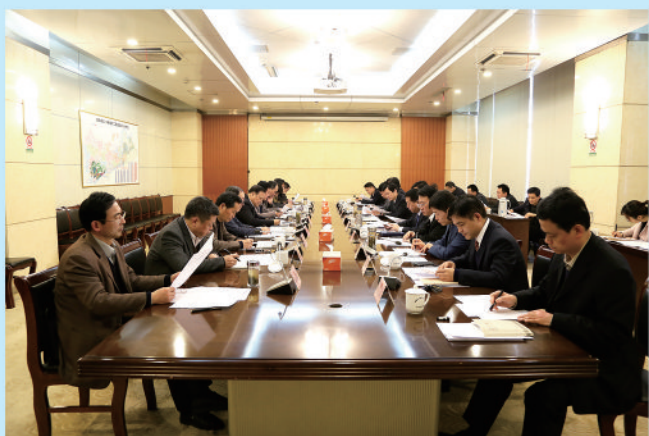
市人大常委会与市政府召开联席会议。