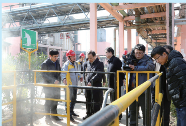
市人大常委会就省人大常委会“一法一条例”执法检查组发现问题整改落实情况开展督查活动。