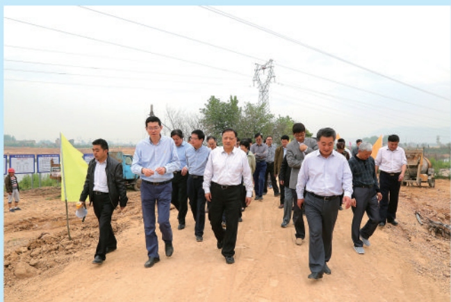
市人大常委会集体视察农田水利建设暨灾后重建工作。