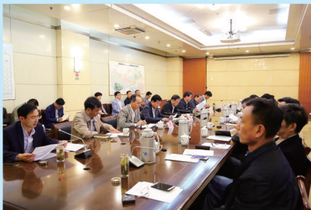
市人大常委会及机关召开推进“两学一做”学习教育常态化制度化工作会议。