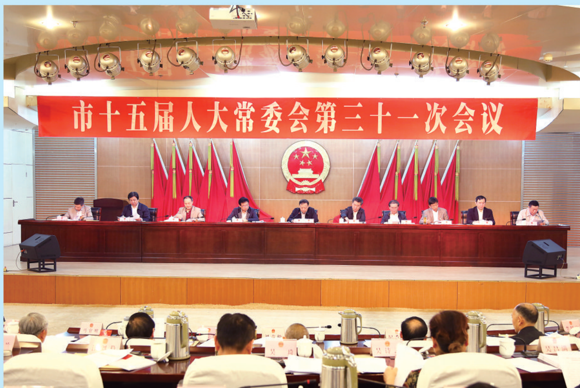
市人大常委会第三十一次会议在市行政会议中心举行。